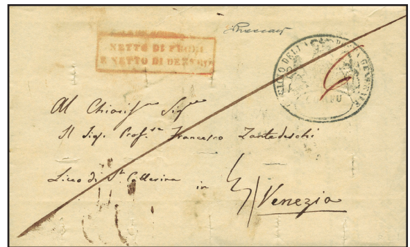
Da Corfù a Venezia nel 1840; ha il bollo di disinfazione “Netto di fuori/e netto di dentro”.

Qual è il valore commerciale medio di tali reperti? “Varia dai 50,00-100,00 euro per le corrispondenze più comuni, fino ai 1.000,00 o più per le rare”.